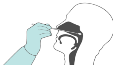
Мазок из носоглотки